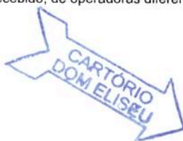
PREFEITO DO MUNICÍPIO DE DOM ELISEU Prefeitura Municipal de Dom Eliseu